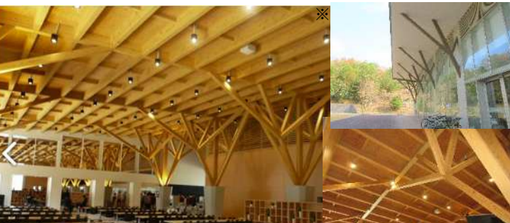
③大分大学学生交流館(2016)-食堂・GIR・GIRによる建築視察