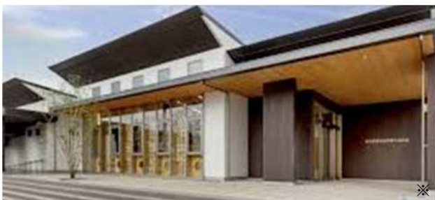
①大分県木材会館(2021)-事務所・軸組工法・SHK制度改革紹介、建築視察

【木造建築物 現地視察】 ★ 木造で中・大規模の非住宅建築を行う際に参考になる事例です ★