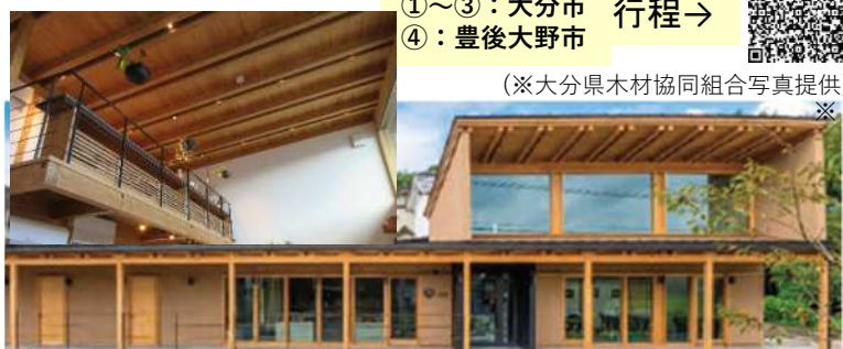
④FUJII BREWERY(2022)-店舗・製材品9mの合わせ梁・講師：日本文理大学 工学部 建築学科 教授 三浦 逸朗 氏・建築視察・講話：非住宅建築物における木造化の可能性