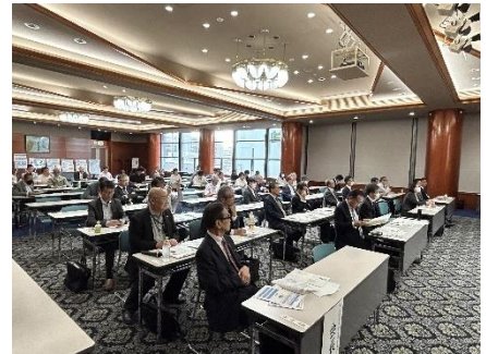
令和5年度産学官金交流大会