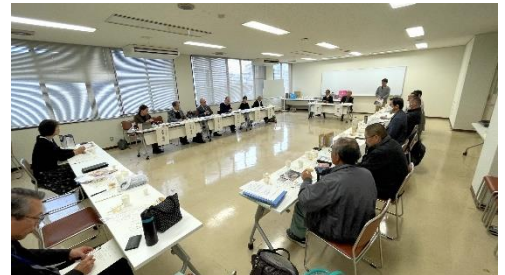
交流グループによるイベント(食品求評会)