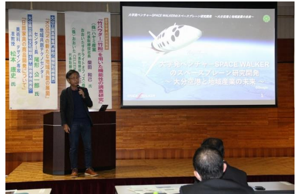
米本先生の基調講演発表