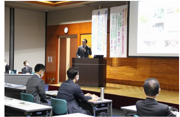
第18グループ 事例発表