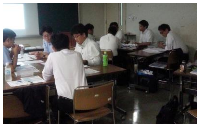
昨年度のワークショップ風景